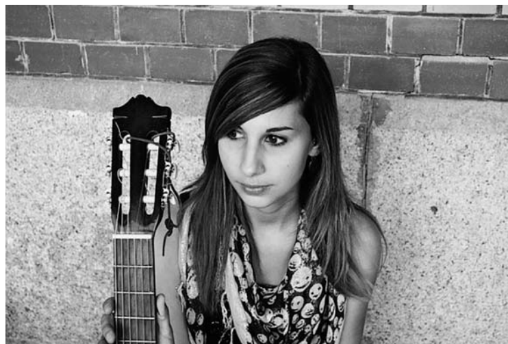
Unter anderem an der Stage Parade 2009 dabei: «Maryam» aus Wiedlisbach und «Roggu macht» aus Roggwil

Samstag, 21. November, 20 .00 Uhr im reformierten Kirchgemeindehaus Langenthal