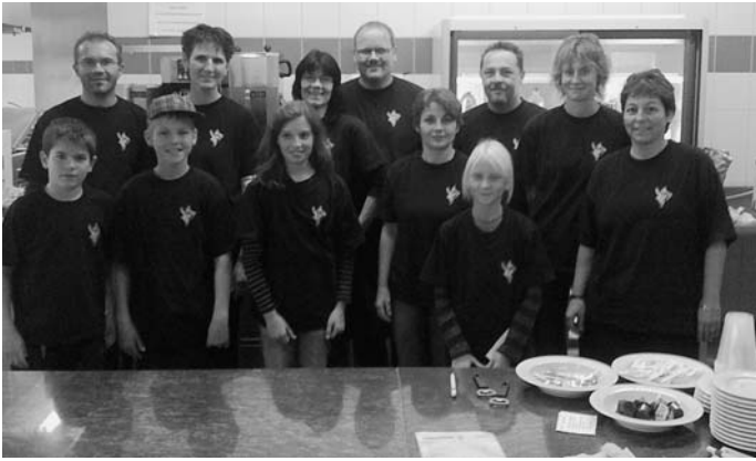
Team des Trägervereins Jugendzentrum Thunstetten-Bützberg.

Die Beliebtheit und der Erfolg der Hobbyausstellung gründen im Wesentlichen auf den genialen Ideen der AusstellerInnen und ihren vielfältigen Produkten und Kunstwerken, die sie mehrheitlich manuell und mit viel Liebe und Herzblut herstellen. Obwohl der kommerzielle Aspekt für die AusstellerInnen klar im Hintergrund steht, wechselt im Verlaufe des Anlasses manch ein Objekt seinen Besitzer. Und der eine oder andere Besucher der Ausstellung wird vom Virus befallen und holt sich erste Ideen, um selber aktiv zu werden. Die Ausstellung bietet eine breite Palette an Möglichkeiten, wie man sich kreativ betätigen kann.