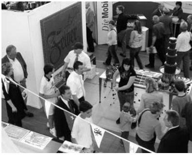
Impressionen büga 2006.