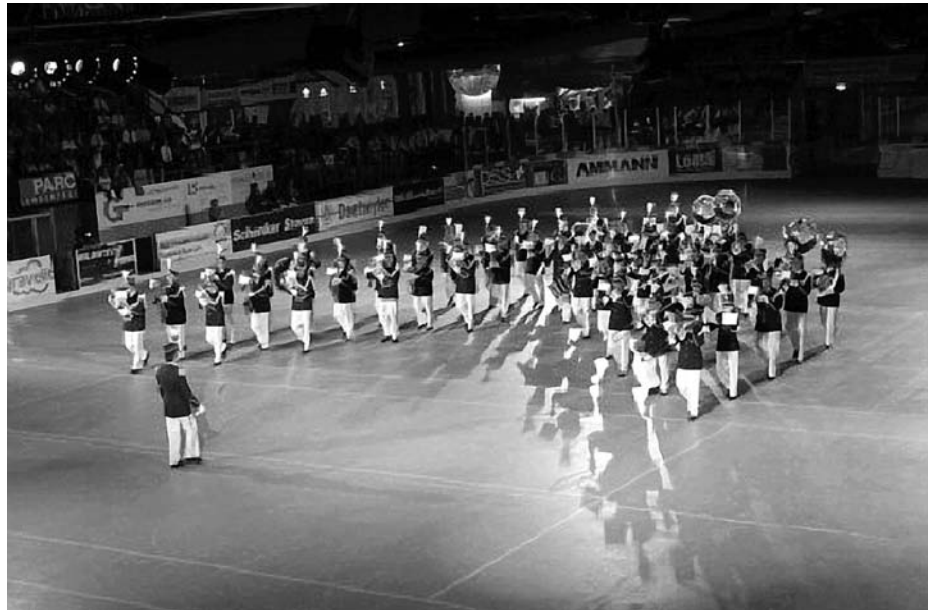
Eines des Highlights des 1. Powwow Oberaargaus: Die Musikgesellschaft Bubendorf.

Das 2. Powwow Oberaargau wird am 16. Mai 2009 unter dem Motto «Begeisterung entdecken» über die Bühne gehen. Nebst Bewährtem aus der ersten Vorstellung wird es auch einige Neuerungen geben. So erscheint im Programm erstmals eine Dudelsack-Band sowie die in Langenthal sehr bekannte Salsa-Forma-